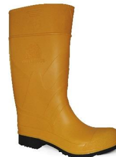
BOTAS PVC / CAUCHO