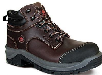
PU / CAUCHO